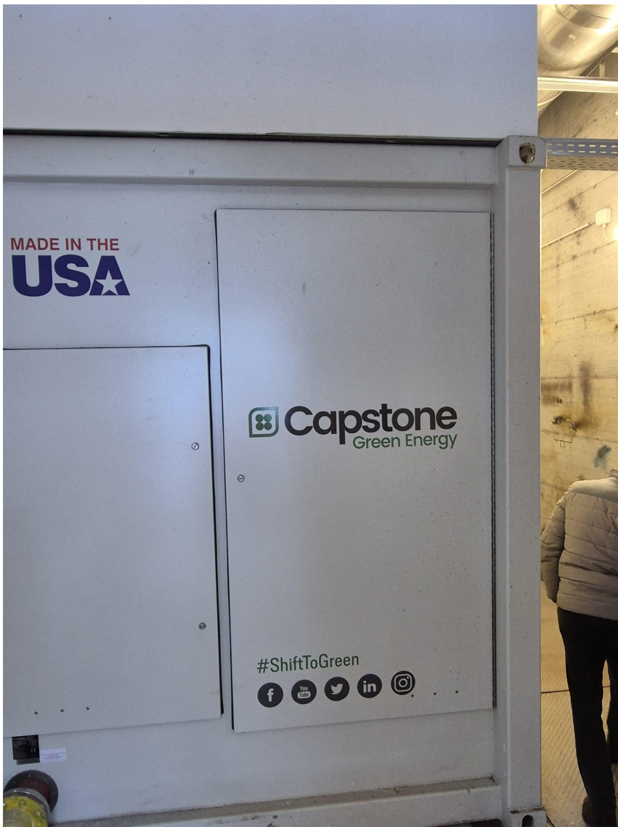
4 - Turbina a gas 2