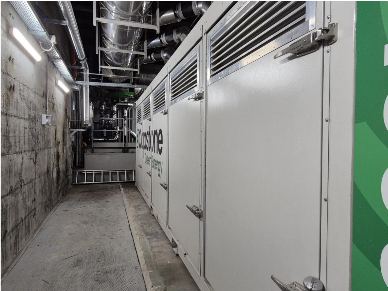
2 – turbina gas 1