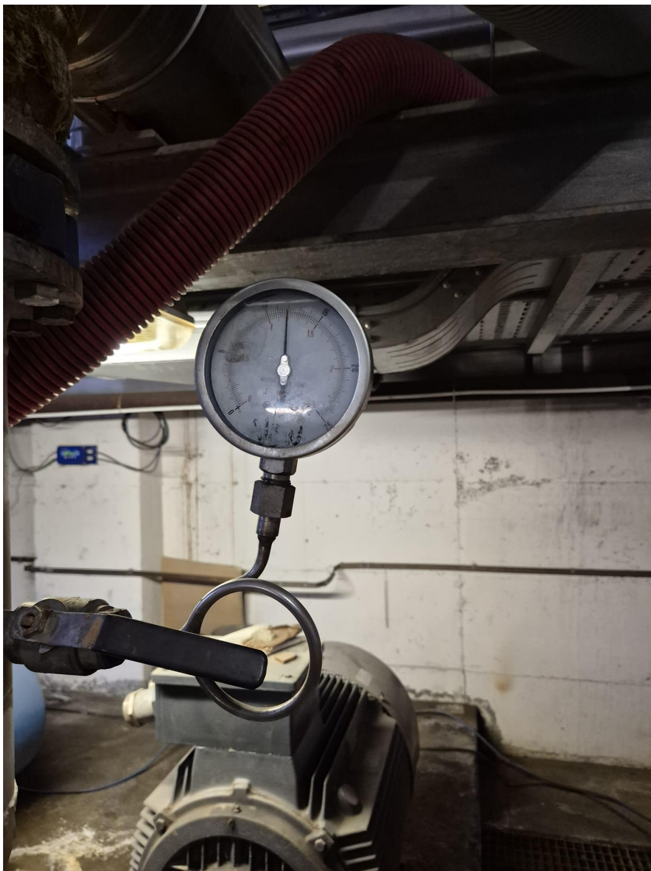
11 – manometro mandata impianto