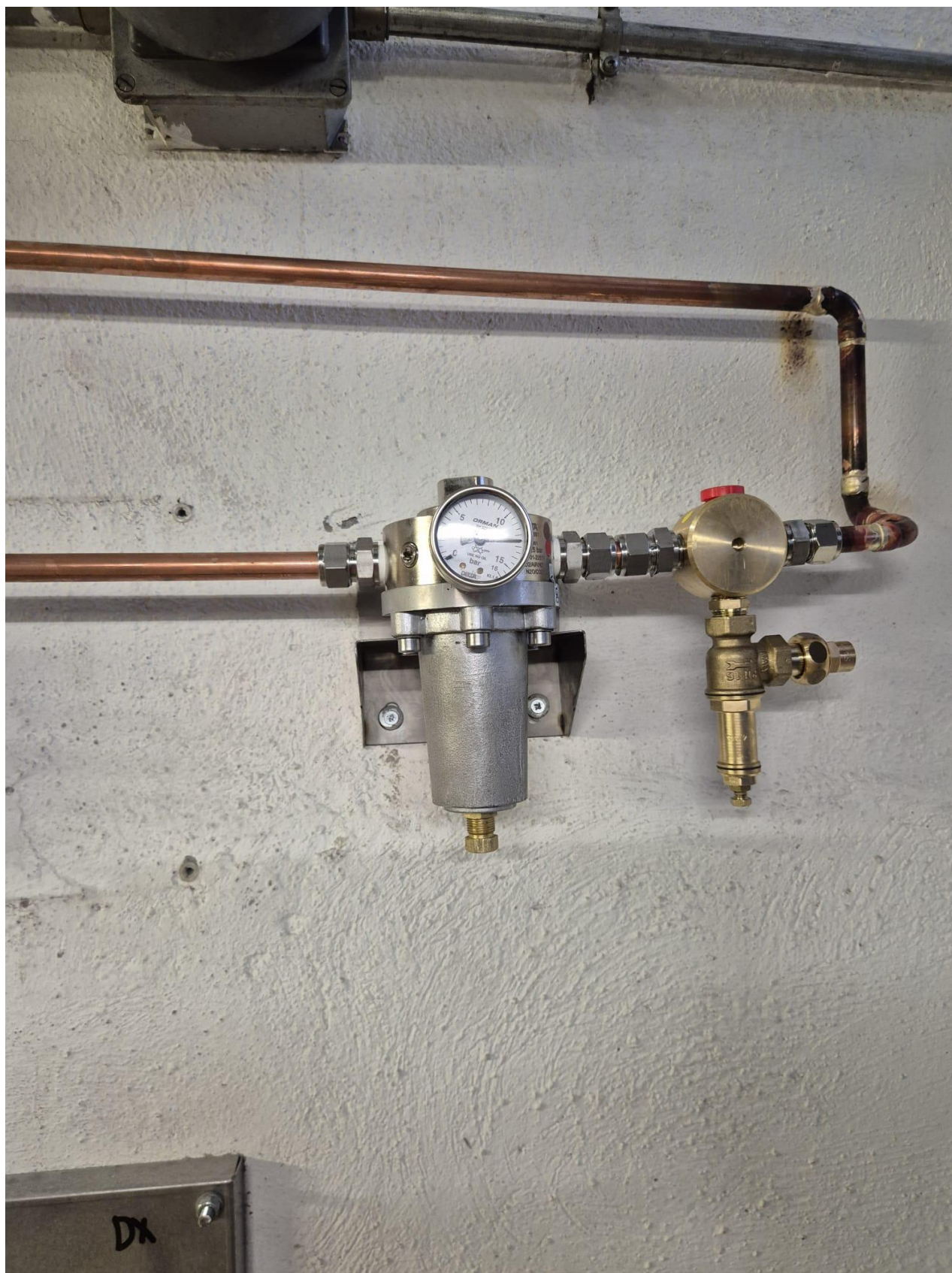
12 – regolatore pressione vaso