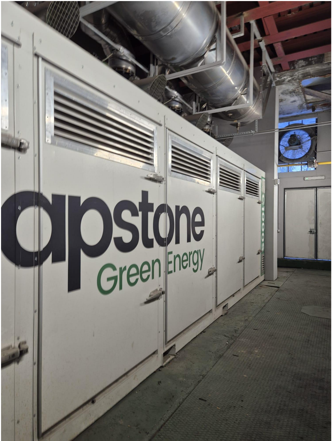
9 - turbina gas