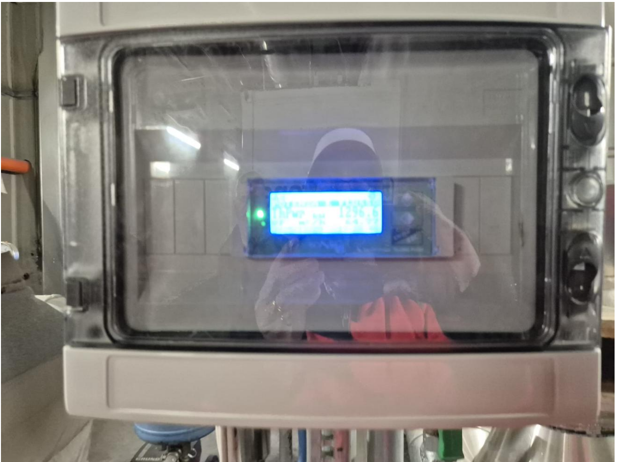
8 - Display produzione turbina gas