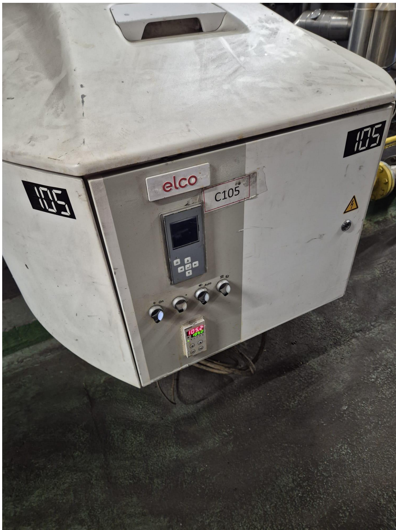
19 – generatore C105