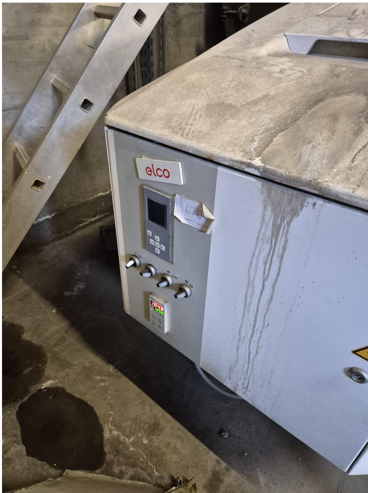
7 – generatore C704