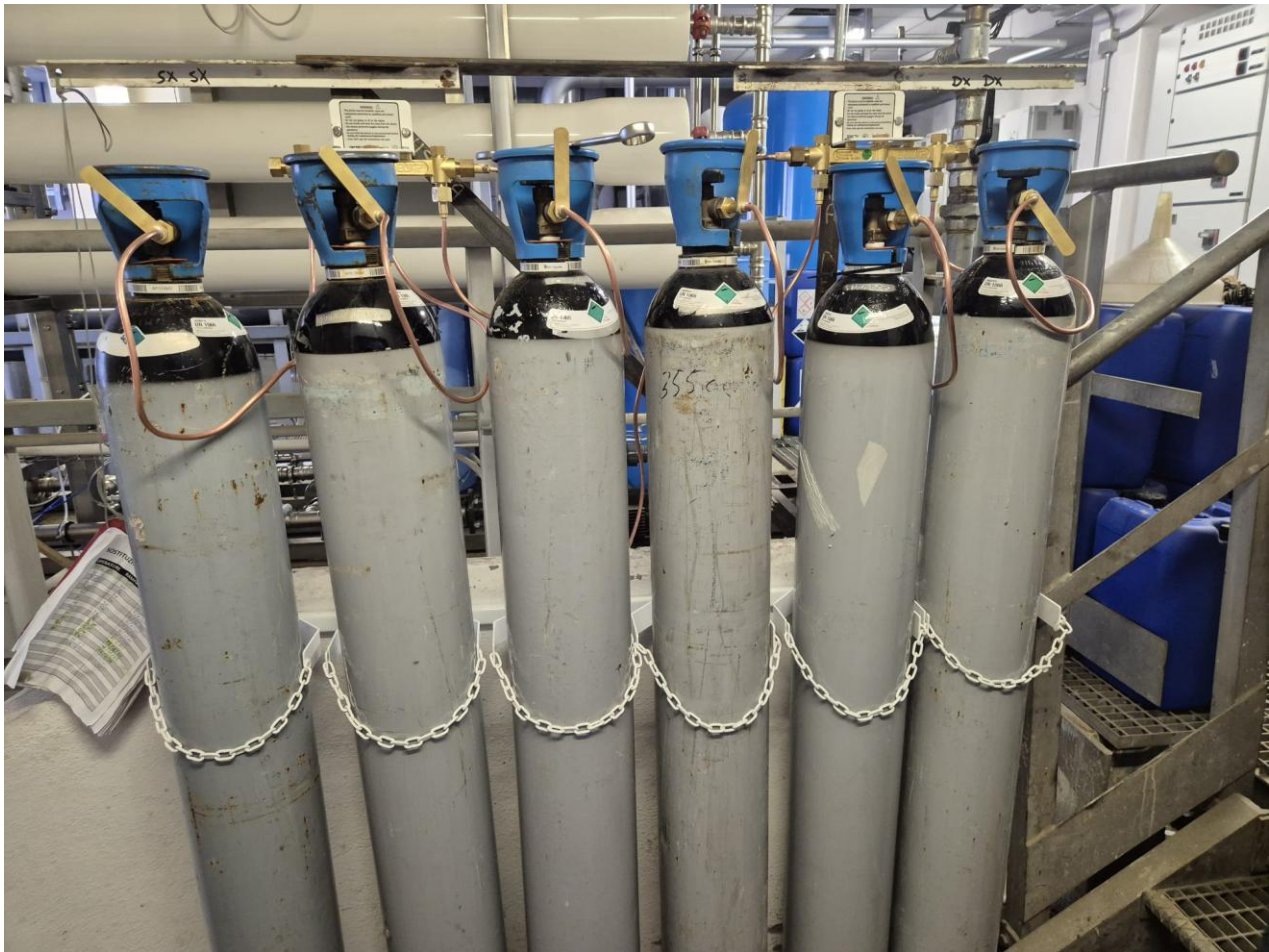
15 – bombole gas per pressurizzazione vaso espansione