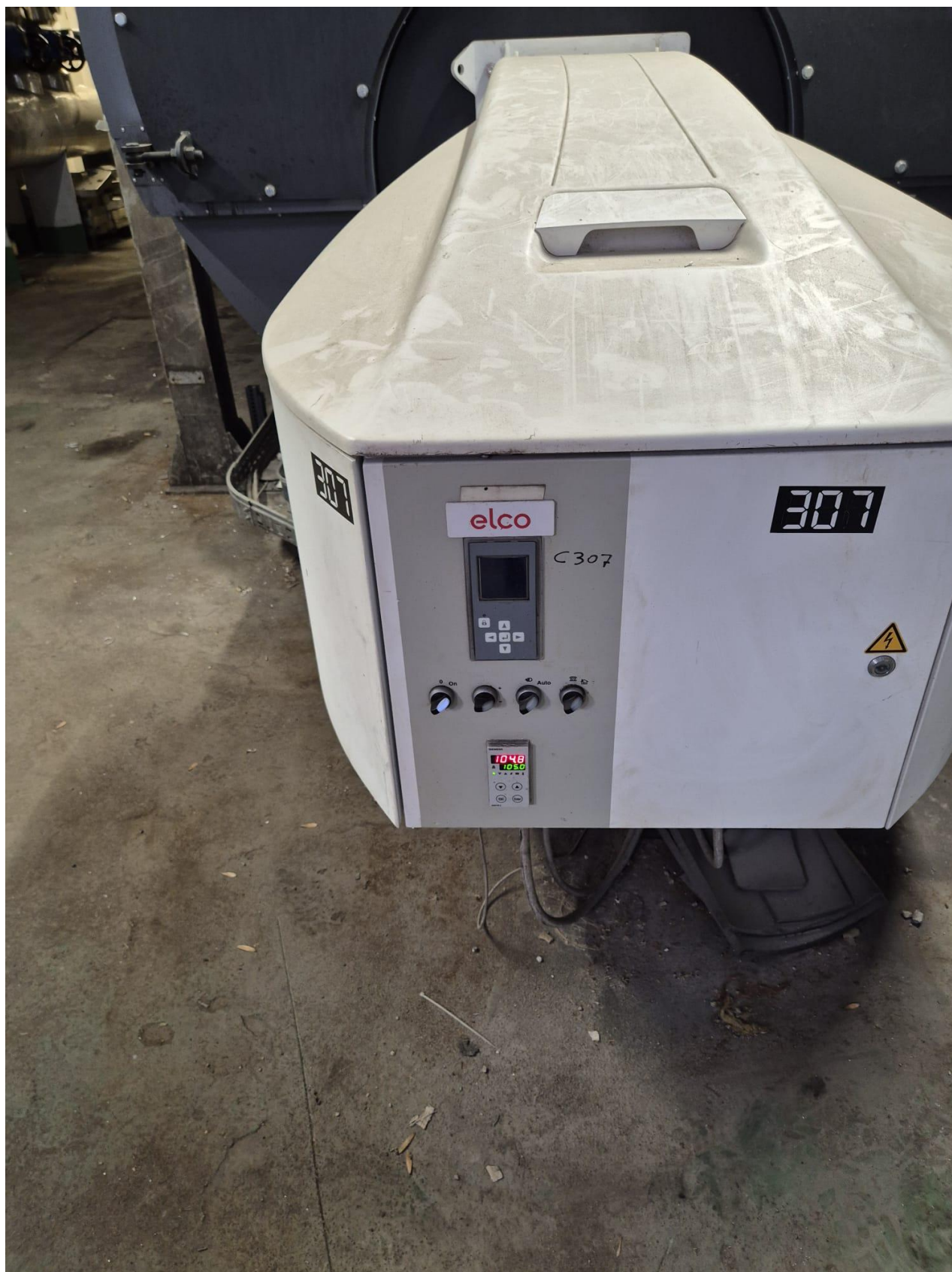
16 – generatore C307