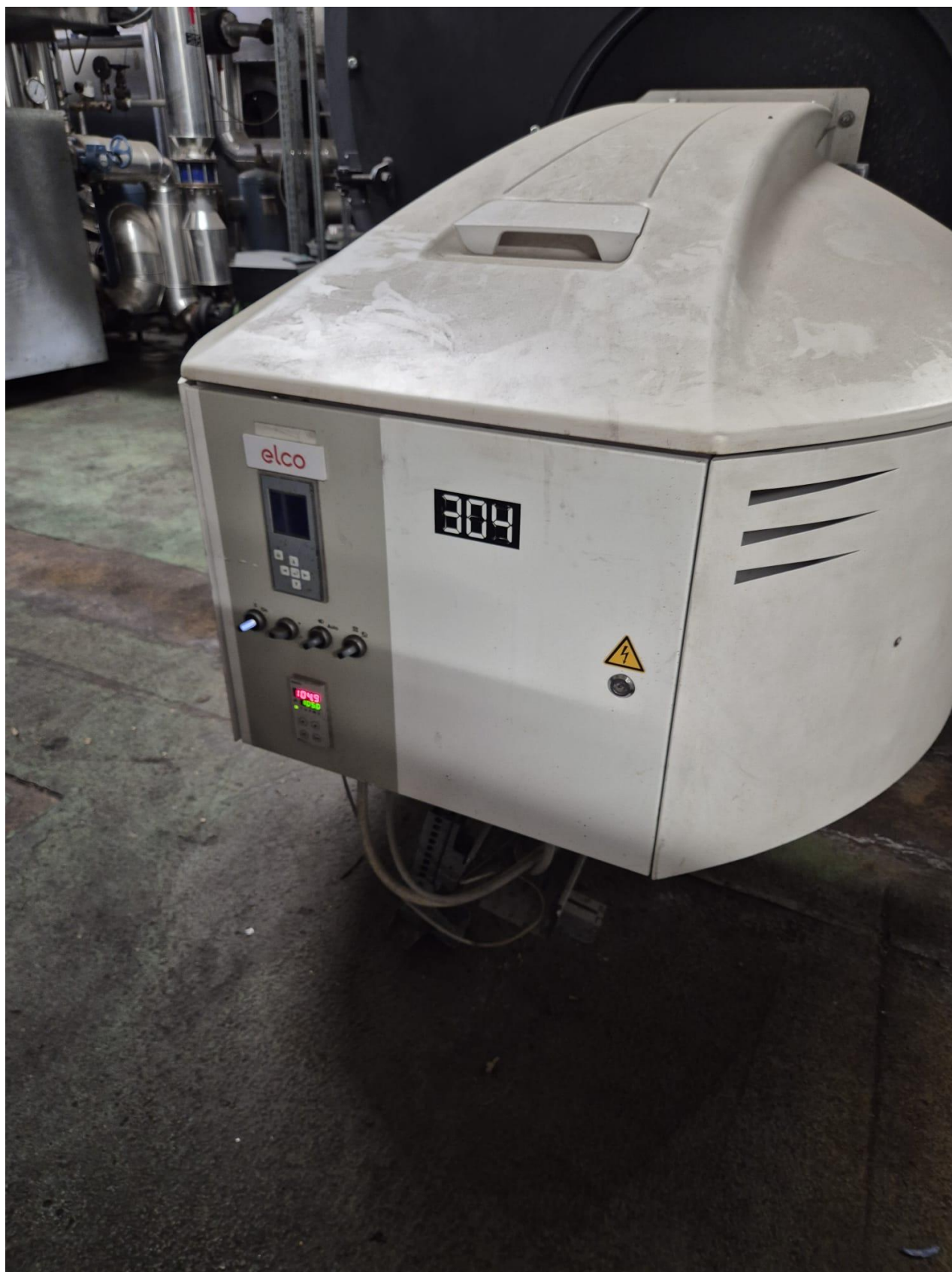
17 – generatore C304