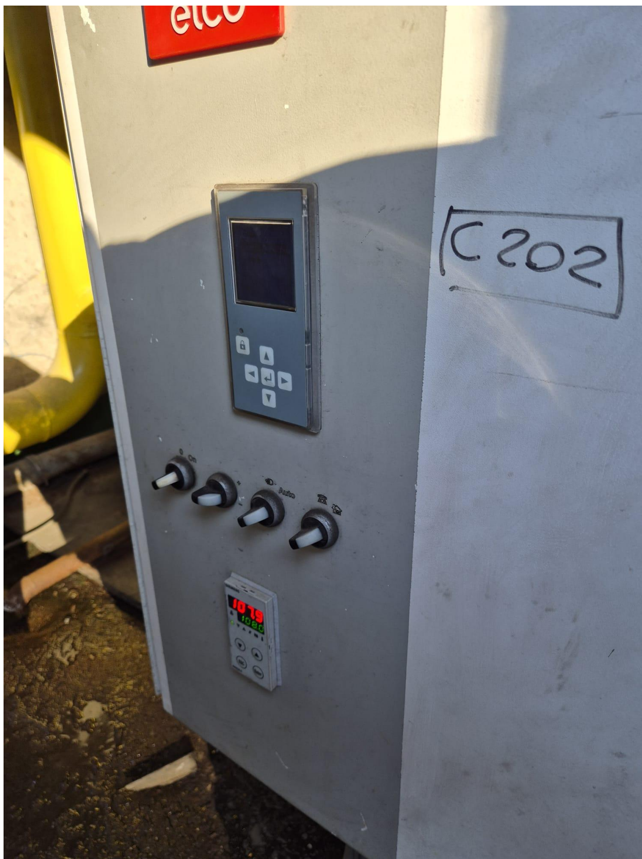
18 – generatore C202