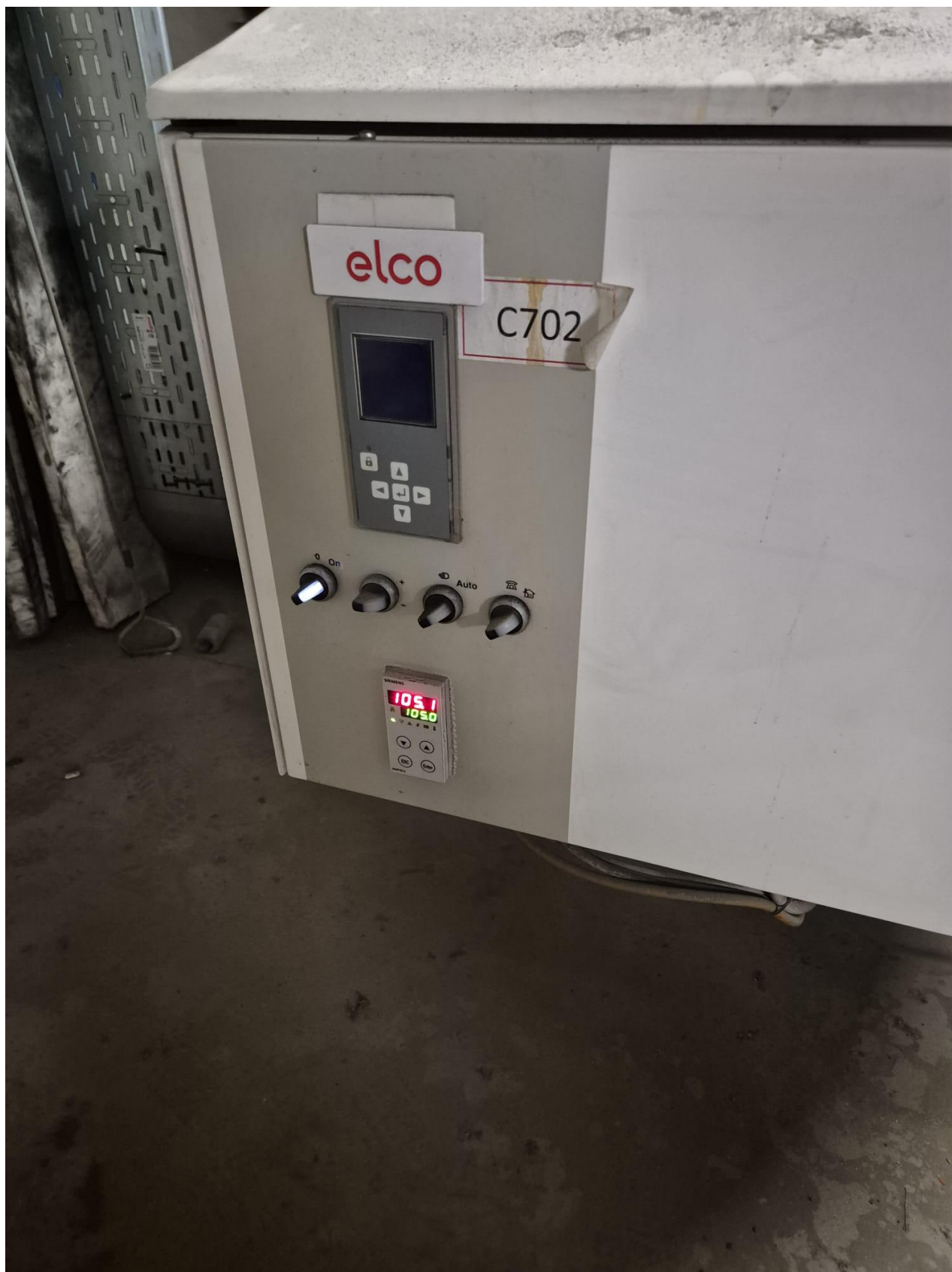
5 – generatore C702