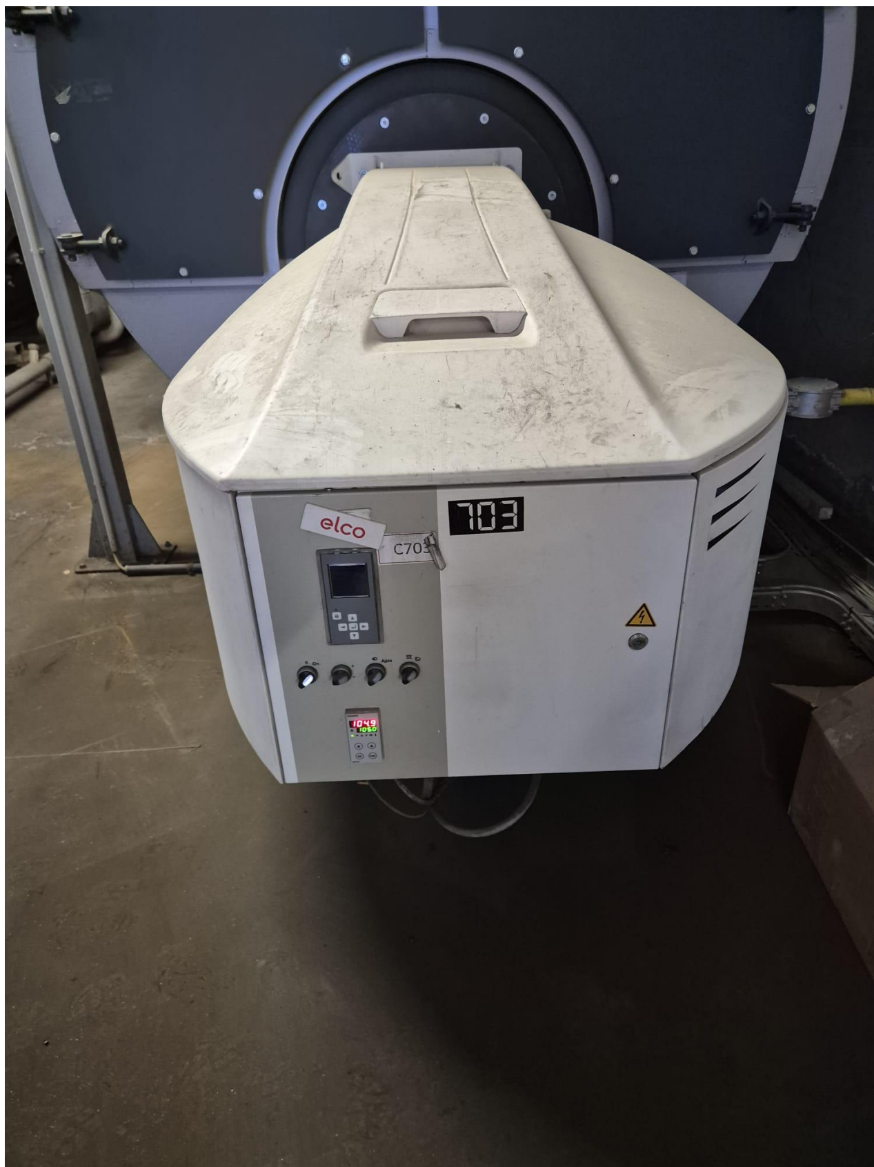
6 – generatore C703