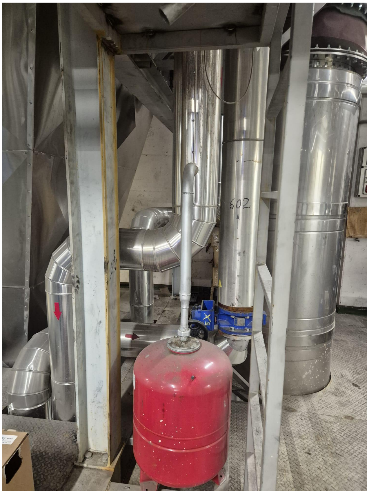
20 – condotte turbina gas