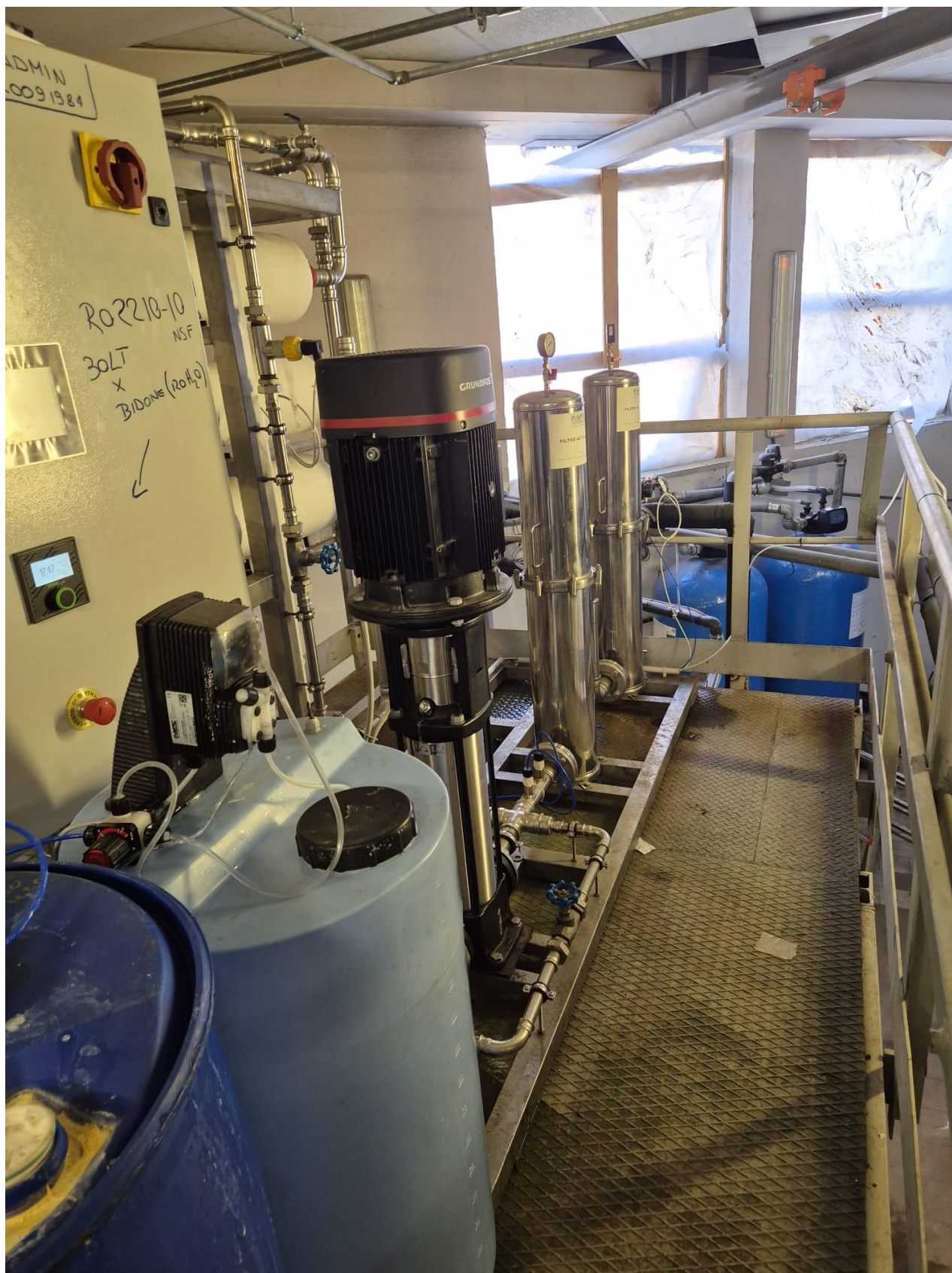
13 – impianto condizionamento acqua di rete