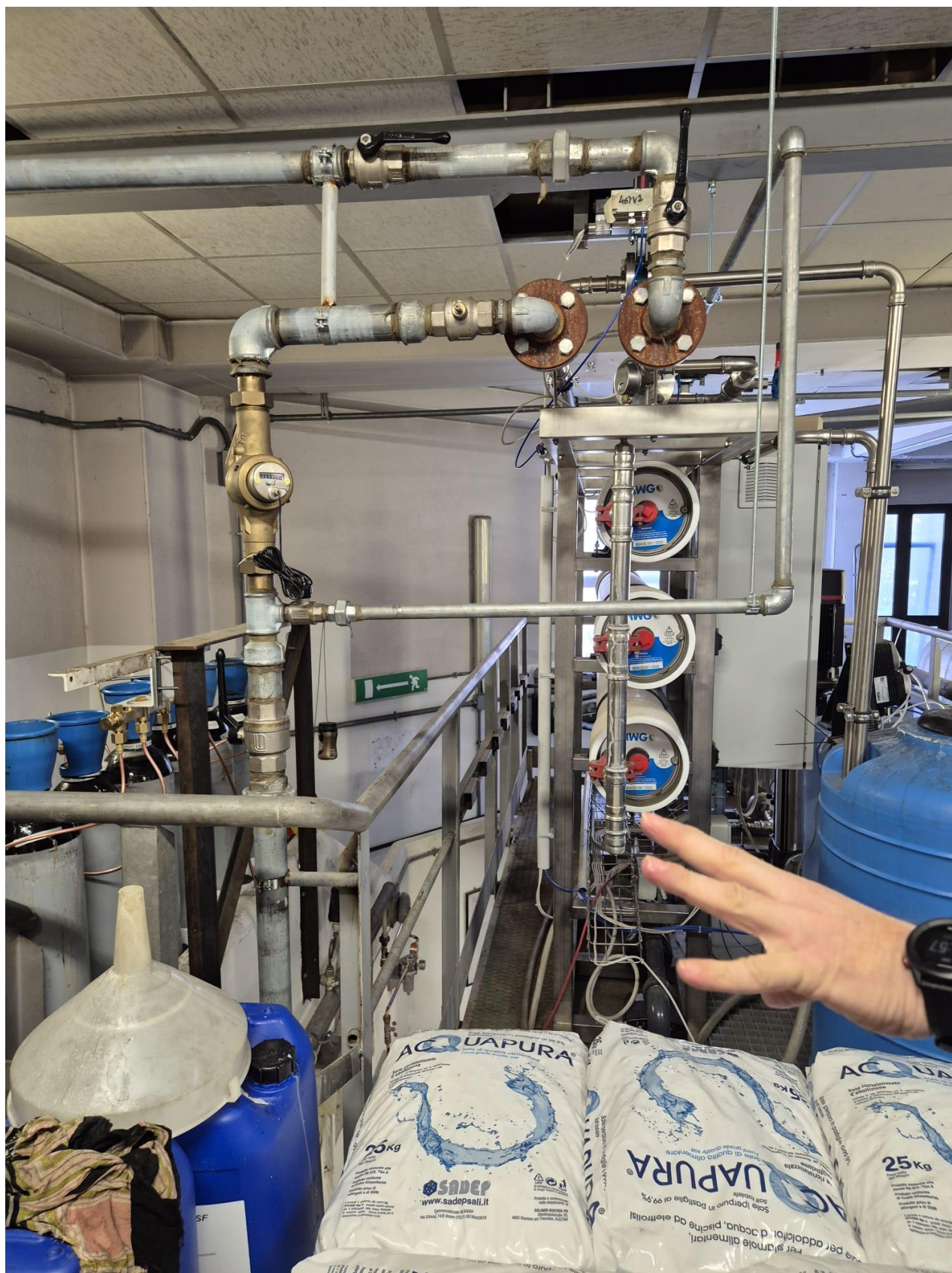
14 – impianto trattamento osmosi acqua di rete