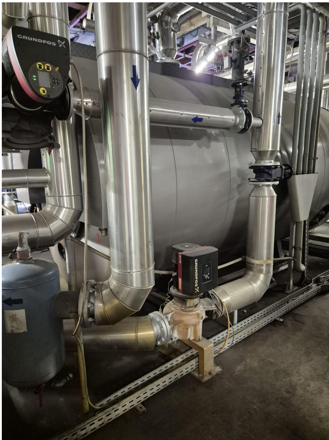
21 – generatore