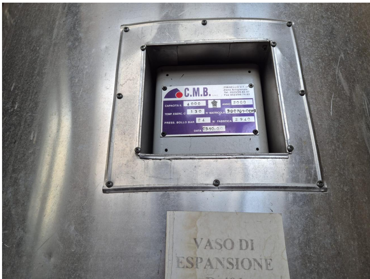
10 – vaso di espansione collegato all'impianto